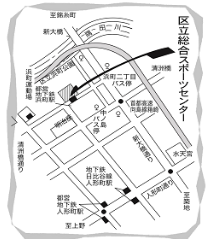
中央区立総合スポーツセンター地図

第4回わんぱく相撲女子全国大会 2023年9月24日(日) 新潟県 新発田市カルチャーセンター